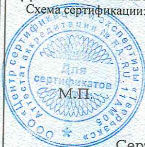
Схема сертификации: Ic